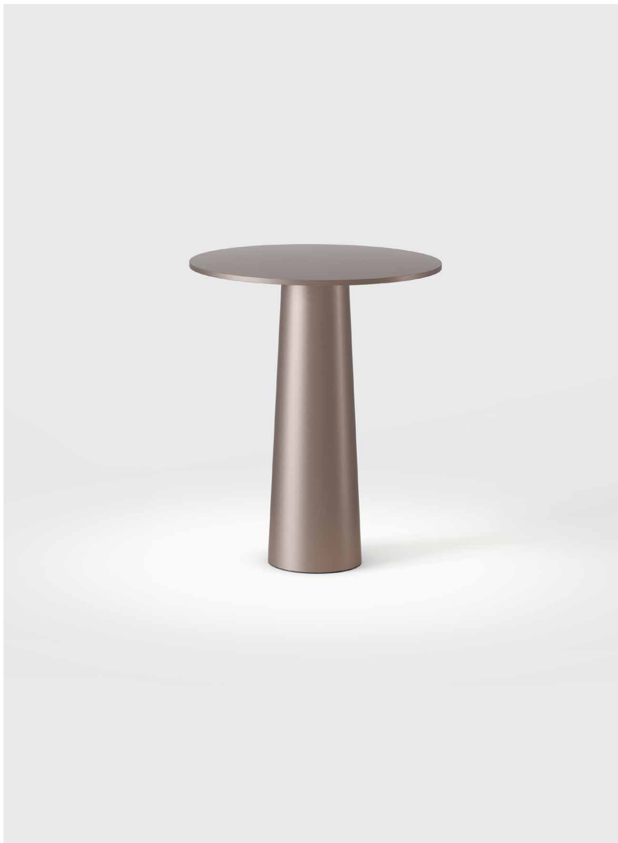
lix mini dim to amber 2700K-1800K Design: Klaus Nolting