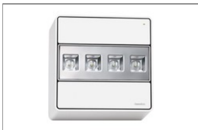
ATRIA 22 (AT,B)