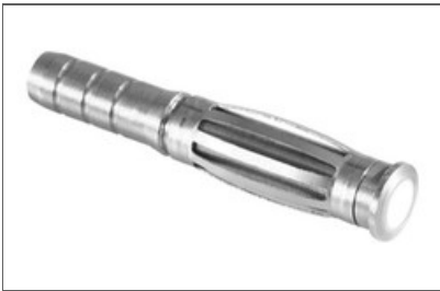
Clavo-MD B (OPAL)