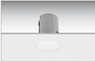
Lens (SEN) DC