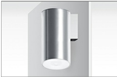
Lens (ESP, AEX) CC