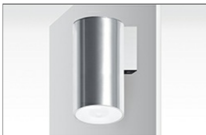
Lens (ESP, AEX) CC