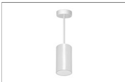
Lens (S) CC