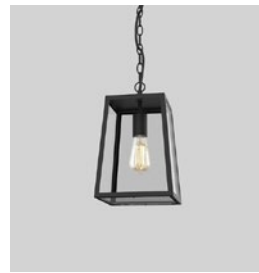
CODE: 1306013 FINISH: TEXTURED BLACK