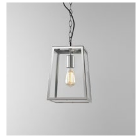
CODE: 1306014 FINISH: POLISHED NICKEL

THIS PRODUCT IS NOT SUITABLE FOR INSTALLATION WITHIN FIVE MILES OF THE COAST. FOR THESE ENVIRONMENTS, PLEASE FILTER PRODUCTS ON THE ASTRO WEBSITE BY 'COASTAL'.