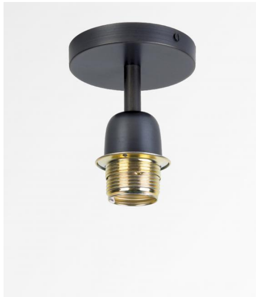
KENTIKA E27 in geborsteld brons