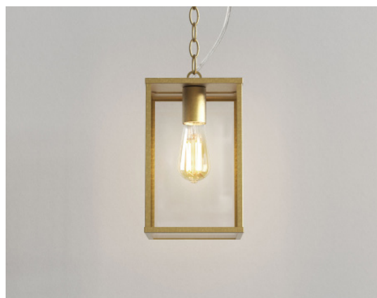
CODE: 1095035 FINISH: NATURAL BRASS

THIS PRODUCT IS NOT SUITABLE FOR INSTALLATION WITHIN FIVE MILES OF THE COAST. FOR THESE ENVIRONMENTS, PLEASE FILTER PRODUCTS ON THE ASTRO WEBSITE BY 'COASTAL'.