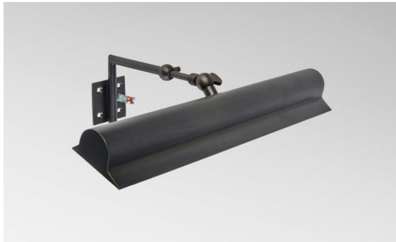
ET 33 in geborsteld brons