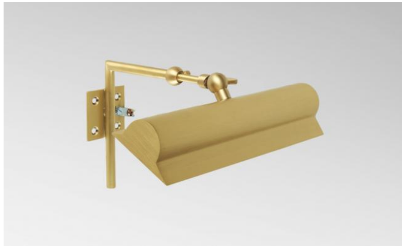
ET 22 in gesatineerd messing