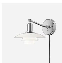
PH 2/1 Wand