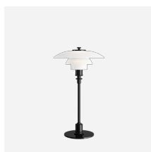
PH 2/1 Tafel