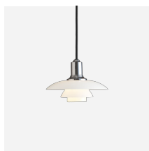
PH 2/1 Hanglamp