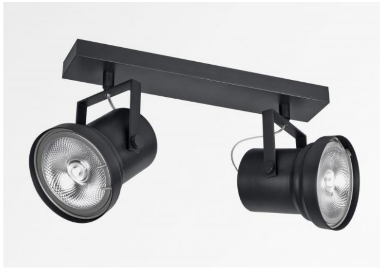
ATHENA 2 en bronze griffé