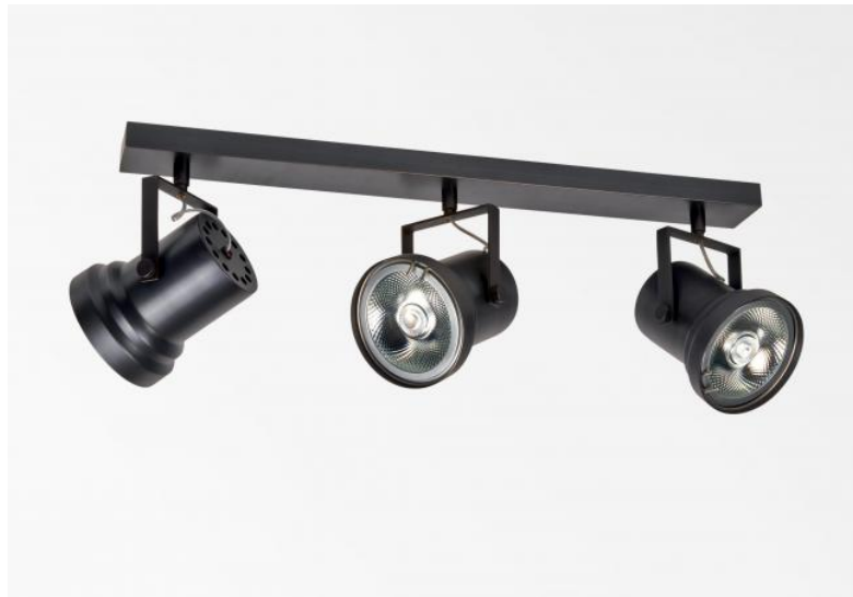
ATHENA 3 en bronze griffé