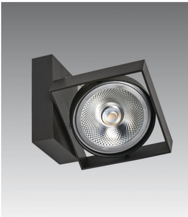
SARGAS 1 in geborsteld brons