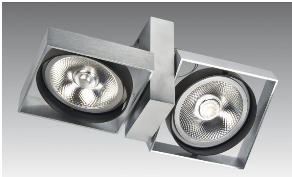
SARGAS 2 in gesatineerd chroom