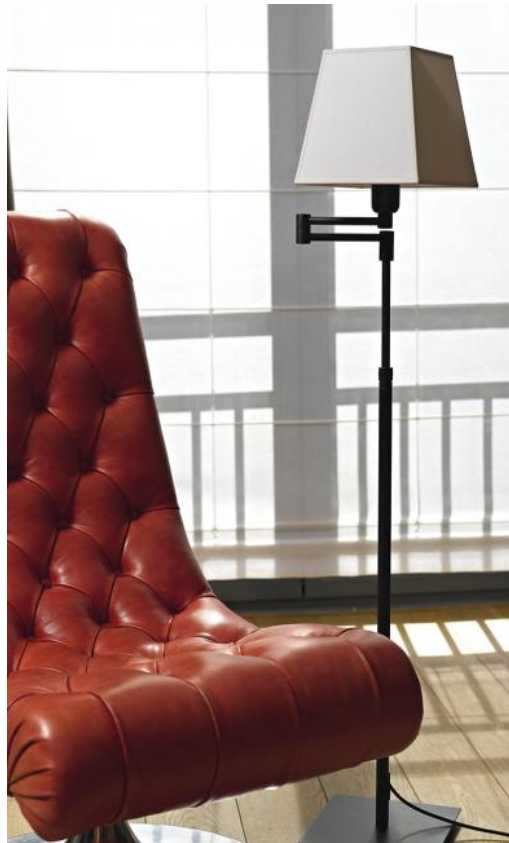
REKMARE en bronze griffé avec abat-jour en Coton calcaire (tissu de catégorie 1)