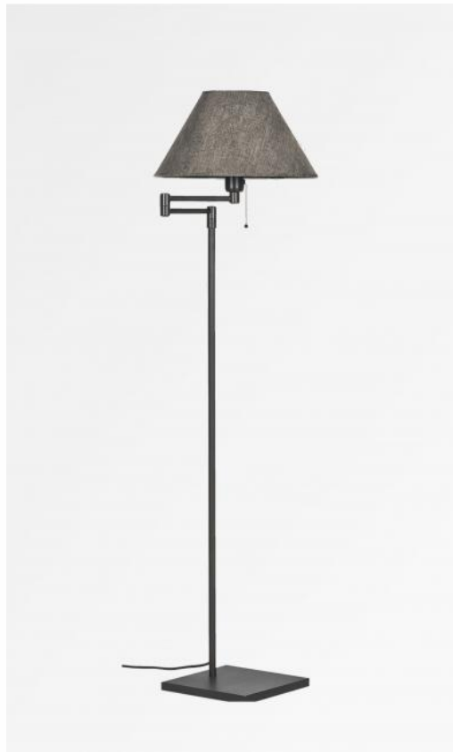
NEKAO in geborsteld brons met lampenkap in Trento lave (stof uit categorie 3)