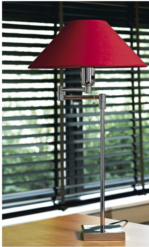
SENNEDJEN in gepolijst chroom met lampenkap in Coton groseille (stof uit categorie 1)