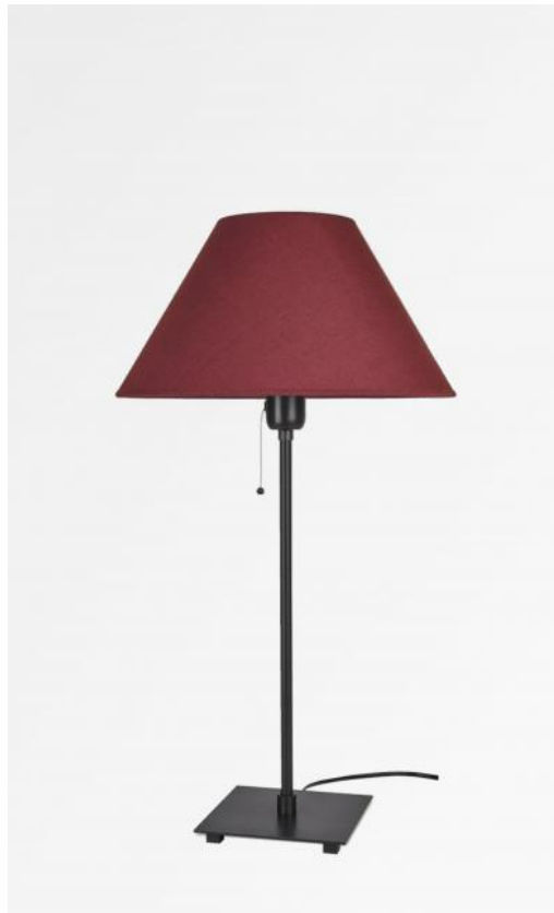
HOURGADA in geborsteld brons met lampenkap in Seta framboise (stof uit categorie 3)