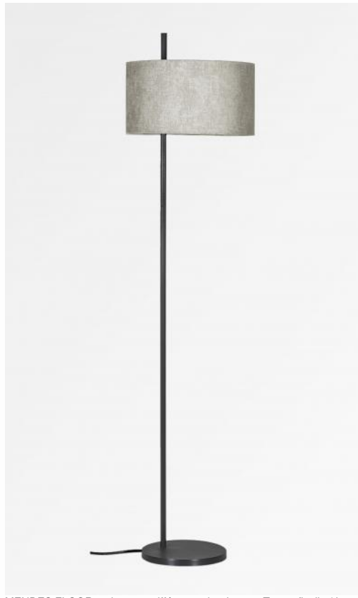
MENDES FLOOR en bronze griffé avec abat-jour en Trento ficelle (tissu de catégorie 3)