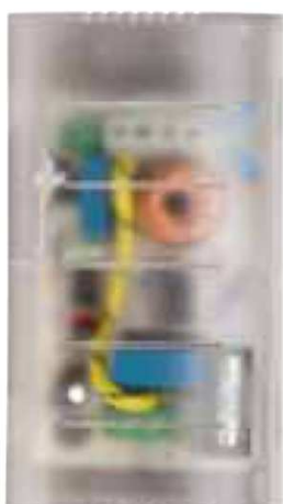
RT78SC LED T Cod. RN0141/LED