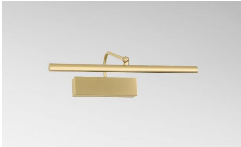
VERSAILLES 35 en laiton satiné