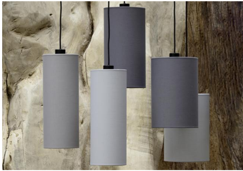
ZIBAL 5 en bronze griffé avec abat-jour en Coton gris, tourterelle et schiste (tissus de catégorie 1)