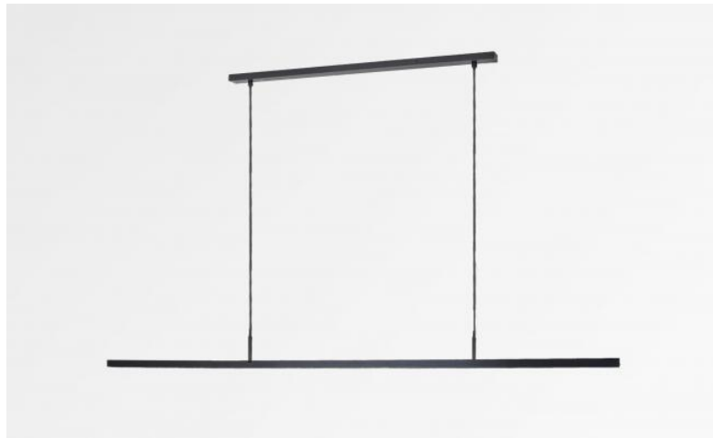
POLARIUS 150 en bronze griffé