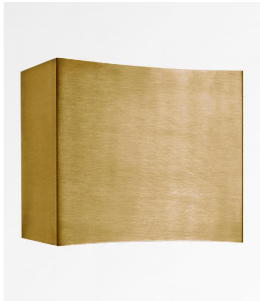
NAXOS en bronze léger