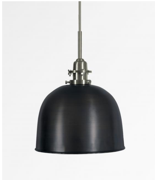
SUPERNOVA en bronze griffé et nickel satiné (code 93)