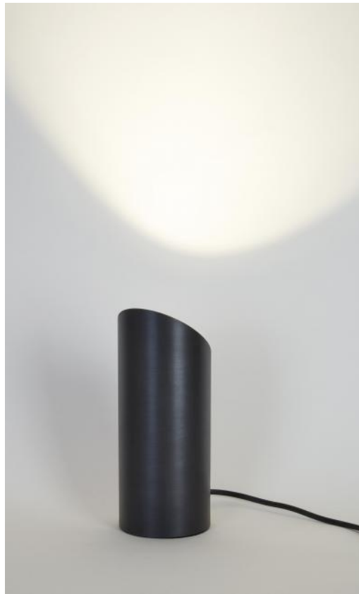
UP 90 en bronze griffé