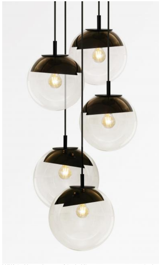
LUNA 5 o26 en noir structuré (code 02) avec verres transparents (code 80)