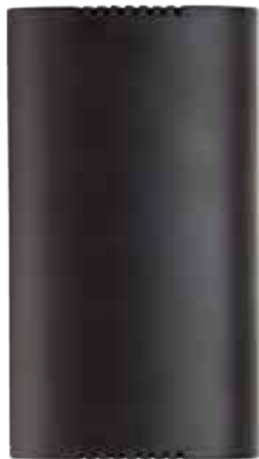
RT78SC LED N Cod. RN0145/LED