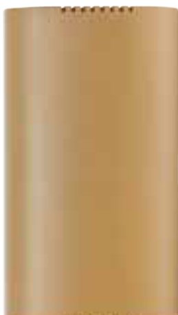
RT78SC LED P Cod. RN0142/LED