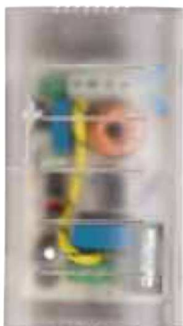
RT78SC LED T Cod. RN0141/LED