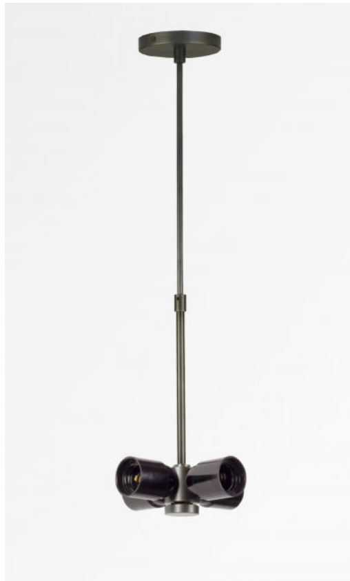
SUSPENSION o TUBES NOURRICE in geborsteld brons